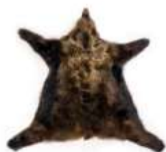
Шкуры зверей (Канада, Россия)