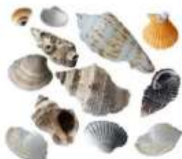
Морские ракушки (Южной Америки на островах Океании)