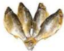
Сушеная рыба (Исландия)