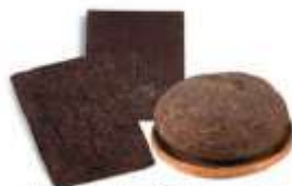
Кирпичный чай (Монголия)